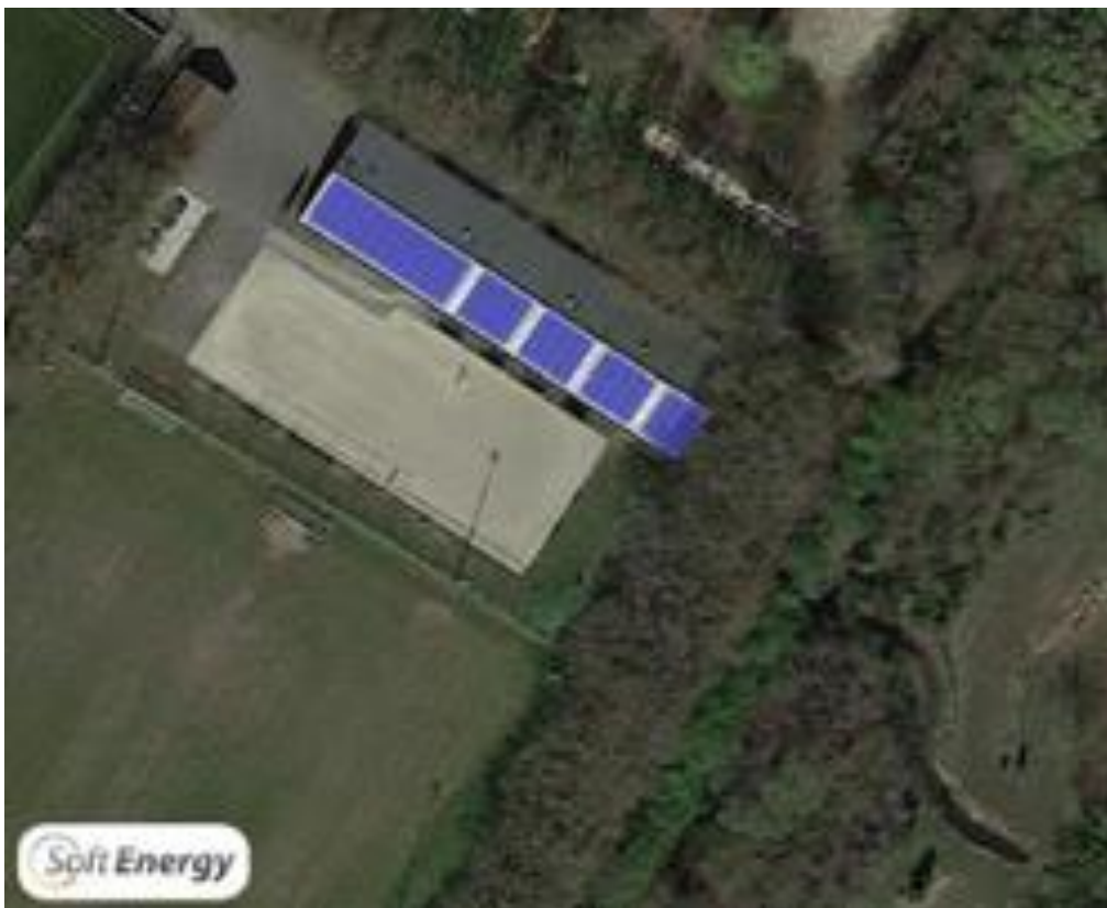
Impressie indeling zonnedak